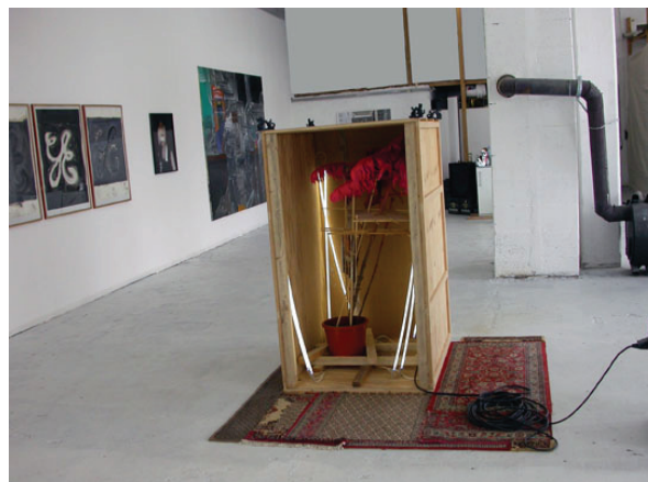
Abbildungen oben: Ausstellungsansicht der letzten Ausstellung "Opfer der reichen Braut" 2008

Dieses Jahr liegt der Fokus der Ausstellungsreihe auf rein bildhauerischen Standpunkten. Einmalig hierbei ist jedoch die Zusammenstellung der teilnehmenden Künstler und ihre jeweilige Auseinandersetzung mit dem Genre.